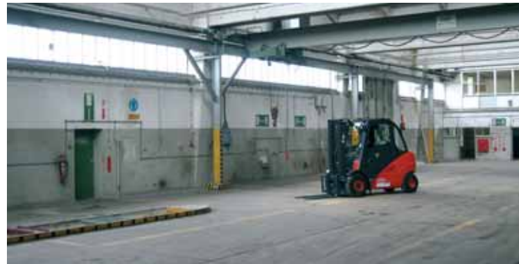
Schwergutlageraum, Stapler bis 3,5 to., Kranbahn bis 5 to.