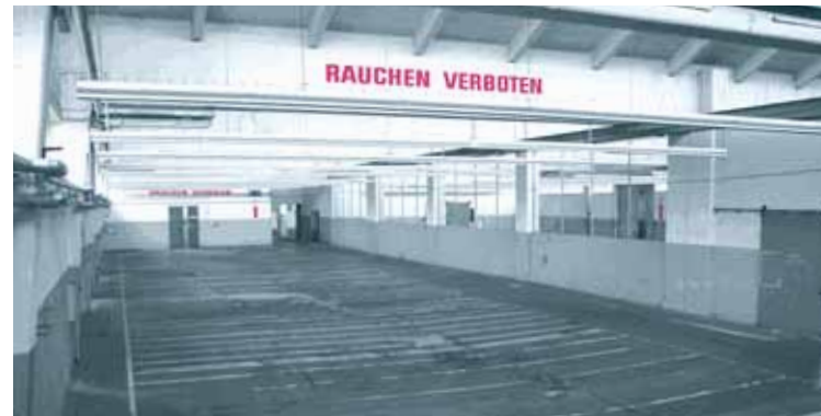
Lageraum ca. 1000m 2 für Blockbodenlagerung