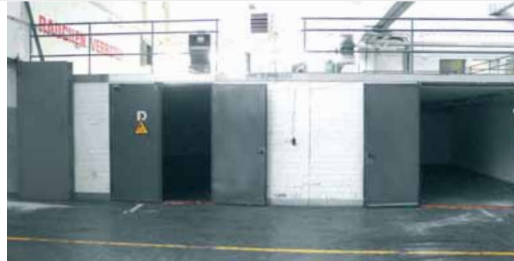
Speziallagerräume, vorgesehen für wassergefährdende und brennbare Stoffe